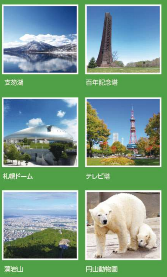
支笏湖 百年記念塔 札幌ドーム テレビ塔 藻岩山 円山動物園