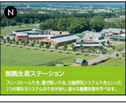
N 酪農生産ステーション

フリーストール牛舎、繋ぎ飼牛舎、自動搾乳システム牛舎といった3つの異なるシステムの牛舎があり、様々な酪農形態を学べます。