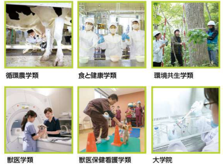
循環農学類 食と健康学類 環境共生学類 獣医学類 獣医保健看護学類 大学院

「酪農学園大学」は、北海道の中心都市・札幌市に隣接する江別市に位置しています。大自然の宝庫・野幌森林公園と接して広がる135万㎡もの広大なキャンパスには、最新の設備・充実の施設を備え、農・食・環境・生命を総合的に追及する「酪農学園大学・大学院」と「附属とわの森三愛高等学校」の2つの学校が配置され、学生・生徒、教職員が一体となって教育・研究・勉学に励んでいます。また、緑豊かな本学園の周辺には、道立図書館や北海道教育研究所、北海道博物館などがあり、理想的な教育環境をかたちづいています。