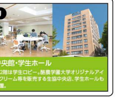
J 中央館・学生ホール

中央館3~7階に設けられ、蔵書数は35万冊。書籍だけでなく、雑誌や新聞、DVDや語学CDなども揃っている。