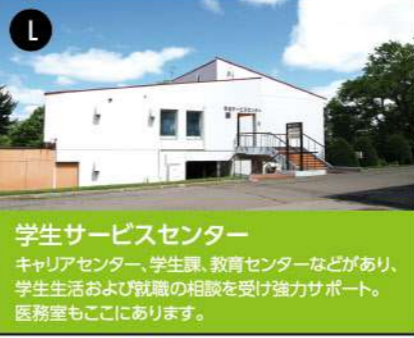
K 学生サービスセンター

大学キャンパスの東側にあります。健康的に安心して暮らせる環境です。また、セキュリティ対策もしっかりしています。