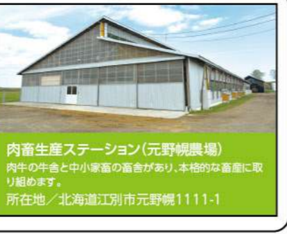
M 肉畜生産ステーション(元野幌農場)

フリーストール牛舎、繋ぎ飼牛舎、自動搾乳システム牛舎といった3つの異なるシステムの牛舎があり、様々な酪農形態を学べます。