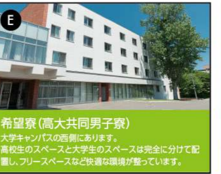
E 希望寮(高大共同男子寮)

大学キャンパスの西側にあります。高校生のスペースと大学生のスペースは完全に分けて配置し、フリースペースなど快適な環境が整っています。