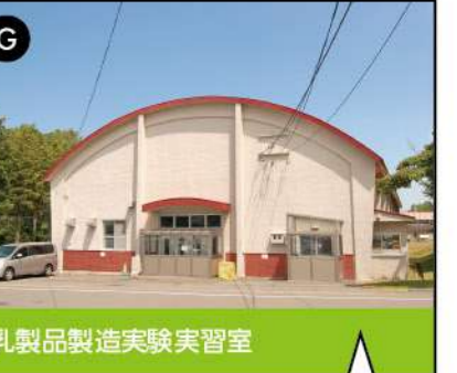
G 乳製品製造実験実習室

キャンパス内のフィールドで生産された新鮮な生乳を使って、牛乳やチーズ、バター、アイスクリームなどの本格的な乳製品づくりを学べます。学内の生協にて委託販売しています。