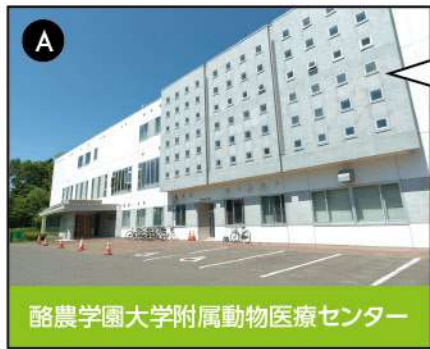
A 酪農学園大学附属動物医療センター

附属動物医療センターは伴侶動物と生産動物の両部門の診療を行い、総診療件数は日本一。専門性の高い診療と動物のためのチーム医療に触れることができます。環境汚染物質・感染病原体分析監視センター、野生動物医学センター、動物薬教育研究センターを併設し、国内の獣医師養成大学の中で最大の施設規模を誇ります。