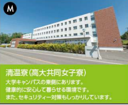
L 清温泉(高大共同女子寮)

肉牛の牛舎と中小家畜の畜舎があり、本格的な畜産に取り組めます。所在地/北海道江別市元野幌1111-1