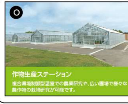
O 作物生産ステーション

全国のみならず世界各地に広がる同窓生のネットワークの拠点として情報を収集・発信。